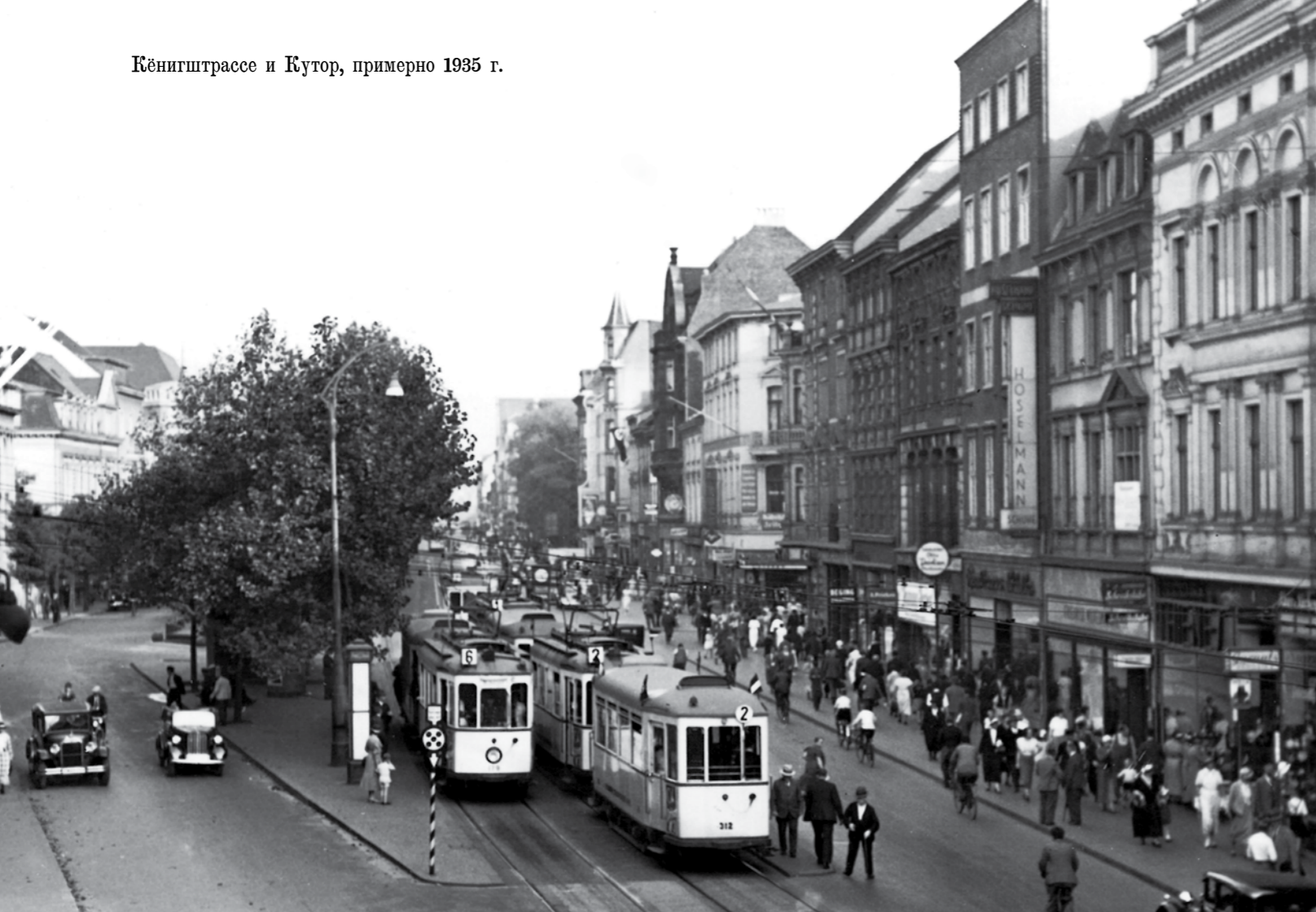
Кёнигштрассе и Кутор, примерно 1935 г.